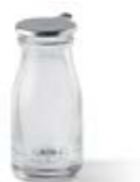
Lechera de mostrador